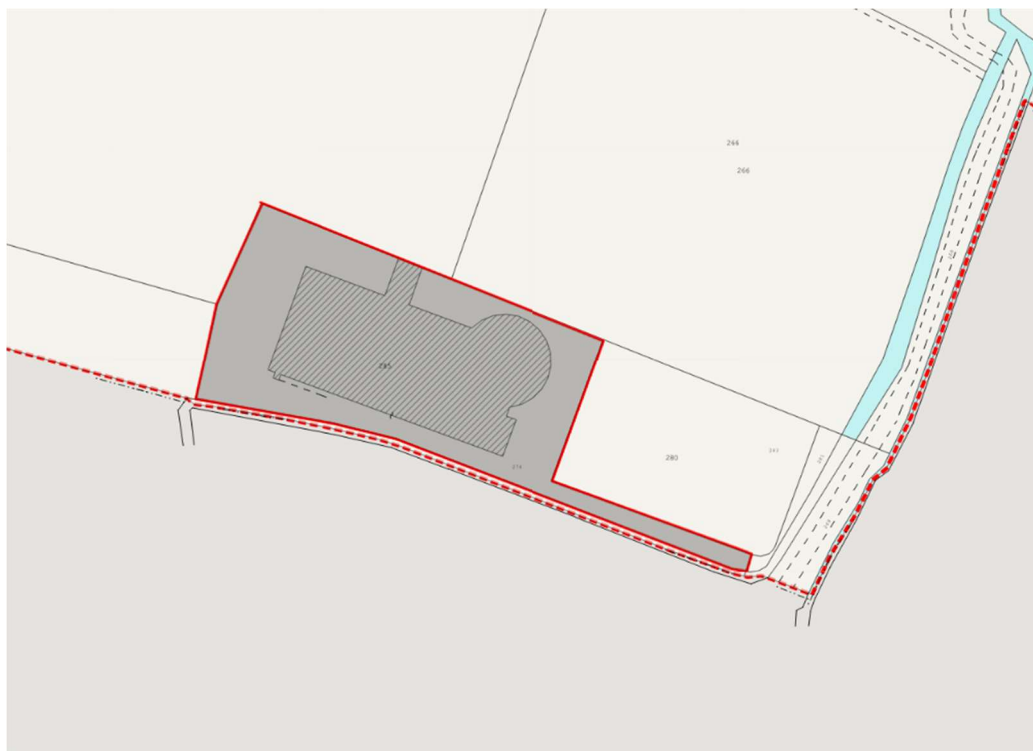
Fig. 235, particella 285